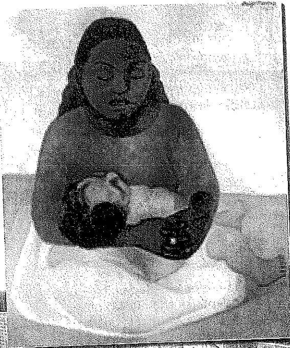
Madre y niño, (1926), Diego Rivera*

A través de su arte y literatura, los países de América Latina y España han expresado siempre la importancia que tiene el amor. Esta característica de la cultura del mundo hispanohablante se mantuvo a través de los siglos y sigue viva hoy.