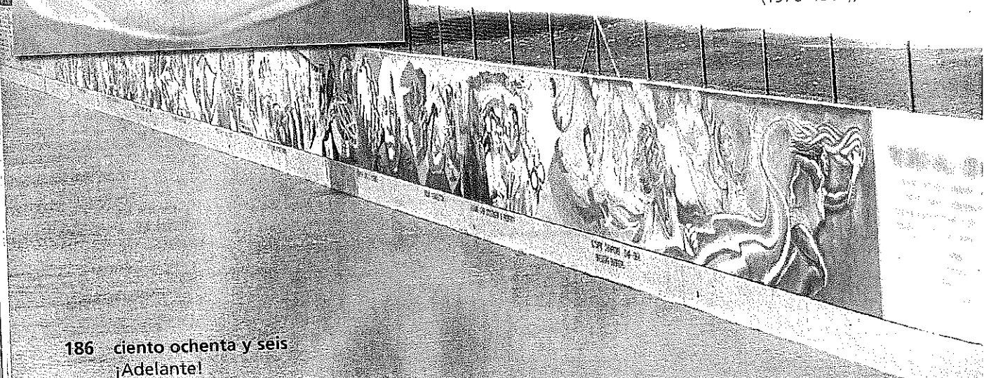
The Great Wall of Los Angeles , (1976–1984), Judith Baca

*© 2004 Art Resource, NY. © Banco de México Diego Rivera & Frida Kahlo Museums Trust. Av. Cinco de Mayo No. 2, Cal. Centro, Del. Cuauhtémoc 06059, México, D.F. Reproduction authorized by the Instituto Nacional de Bellas Artes y Literatura. Art Resource, NY.