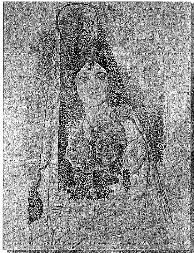
La salchichona , (1917), Pablo Picasso

Oil on canvas, 116 x 89cm. © 2004 Estate of Pablo Picasso/Artists Rights Society (ARS), New York. Musée Picasso, Barcelona, Spain.